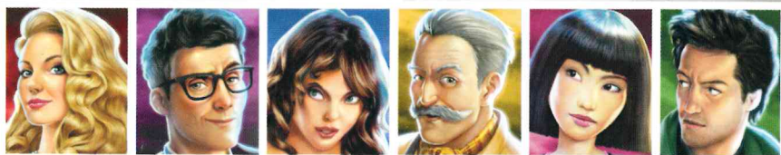
Miss Scarlett Professor Plum Contessa Peacock Colonnello Mustard Dottorosa Orchid Reverendo Green