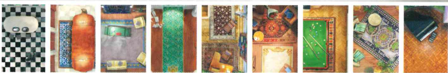
Cucina Sala da pranzo Salotto Ingresso Studio Biblioteca Sala del biliardo Serra Sala da ballo