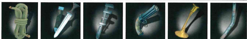
Corda Pugnale Chiave inglese Pistola Candeliere Tubo di piombo