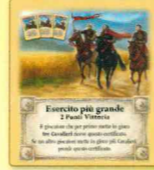
Esercito più grande