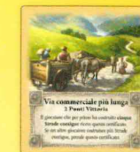
Via commerciale più lunga